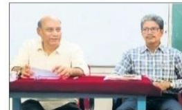
మాట్లాడుతున్న కళాశాల ఆరేజీదీ సాగలింగారెడ్డి

కడవ ఎదుర్కోవడం: నేటి పోటీ ప్రయంకరలో విద్యార్థులకు నైతిక విలువలతో కూడిన విద్య అందించే ద్వారా కళాంశ అత్యంత సాగునిగా ఉండే అంశం న్నారు. కడవ ఎగిరేకలో అందే నీటికే ప్రయత్న మహిళా క్రీడాకారిణీ ప్రయత్నం ప్రతిభాపూర్వకంగా నిరదేశాన్నాడు. యోగా-దృశ్య కార్యక్రమాలతో విద్యార్థులకు బుద్ధులను మోహిస్తోనే ఉంటుంది. కళాంశ అభ్యాసములకు కను సాగే విద్యార్థులు ఖాది వి విద్యార్థులకు నైతిక విలువలతో కూడిన విద్య అందించాన్నారు. యోగా సాధన ద్వారా ఒత్తి, అదోన, మోసనకు యుగ్గులకు పరిణే నమస్కలనులు గానం చేయవచ్చు. ఈ విషయము ప్రజులకు అనుగానా కలిపి యోగాను విలువలనుపరిచు