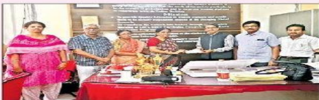
చెక్కు అందజేస్తున్న పూర్వ విద్యార్థులు

19/06/2025 | YSR Kadapa (Kadapa City) | Page : 13